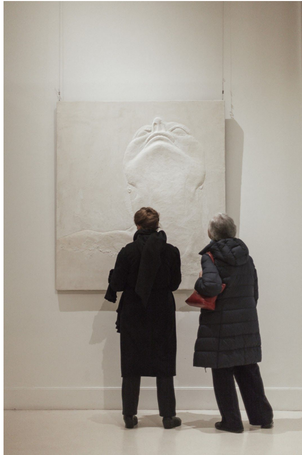
Et ondule la ligne – D Galerie – © Sylvia Rhud