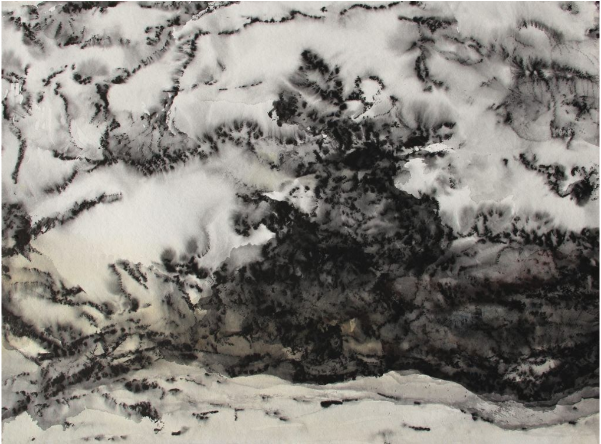
Sylvia Rhud « Echo » diptyque encre (2016) – 56×76 cm – x2

Éparses le long de grandes étendues vides, les lignes de Rada Tzankova arpentent le papier, elles ondulent et mènent le regard vers des successions de plans, de paysages épurés. Le creux a son importance et bien souvent la procession de personnages vient lier les éléments de la perspective, une épopée méditative.